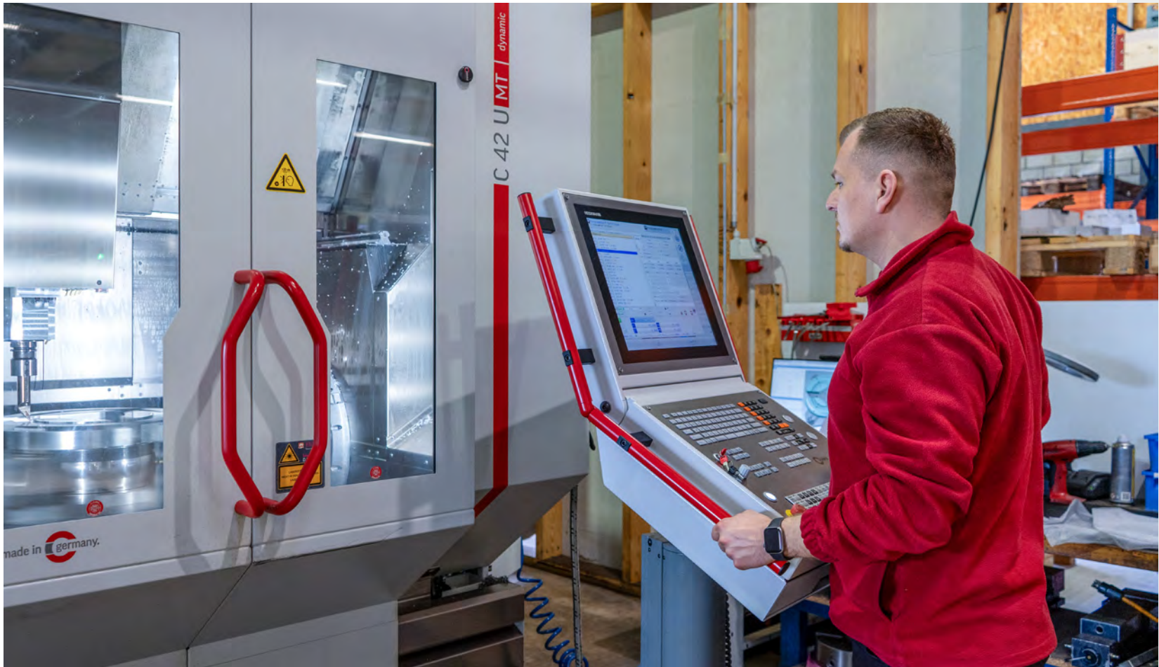
Mit modernsten Technologien und einem klaren Fokus auf Innovation setzen wir neue Massstäbe in der Branche.