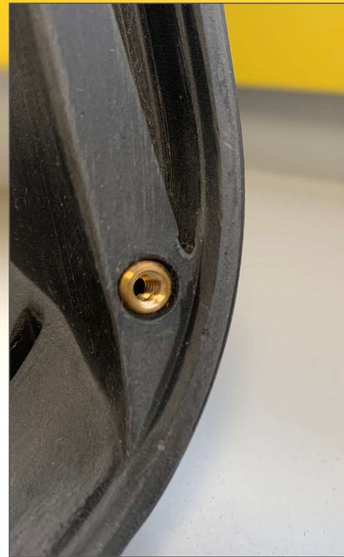
Umschäumen von Einlegern